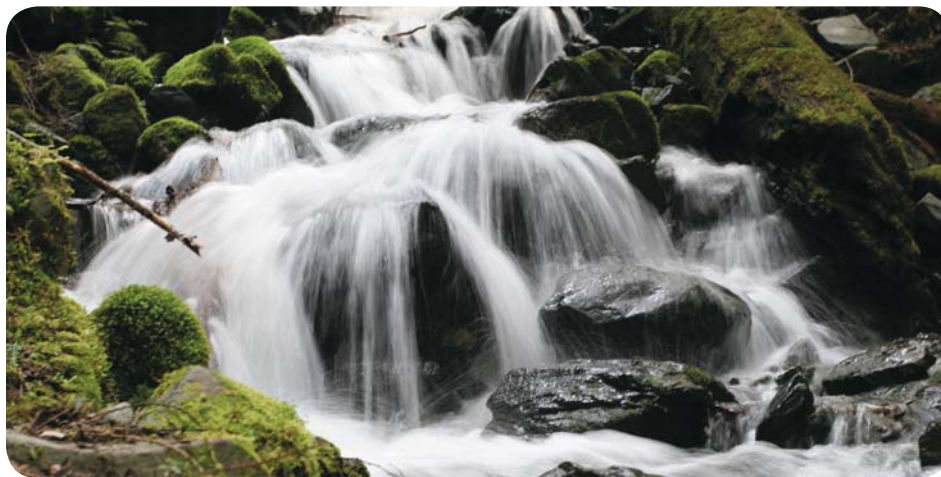
Figure 3 De nombreuses substances sont dissoutes dans les cours d'eau.

L'eau qui sort des robinets de ta maison ressemble probablement à de l'eau pure et a le même goût. Mais l'eau du robinet est une solution qui contient de nombreux solutés, dont du fer, de l'aluminium, du sel, du fluor, du calcium, du magnésium et du chlore. Comment ces solutés se sont-ils retrouvés dans l'eau des robinets de ta maison? Quand l'eau coule dans les lacs et les rivières, ainsi que sous terre, elle entre en contact avec de nombreux types de matière (figure 3). Les gaz présents dans l'air et les minéraux des roches et du sol se dissolvent dans l'eau. Des polluants peuvent aussi s'y dissoudre.