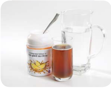
Figure 1 Ce thé glacé a été fait avec de la poudre dissoute dans de l'eau.

dissoudre : mettre un type de matière dans un autre type de matière de manière à obtenir une solution