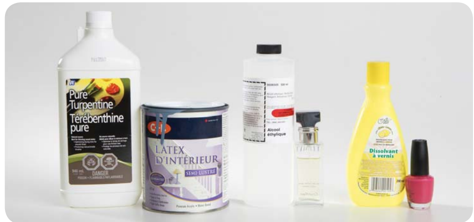
Figure 2 L'alcool éthylique, la térébenthine et l'acétate d'éthyle sont des solvants utiles. Ils permettent de dissoudre de la matière qui ne se dissout pas dans l'eau.

D'autres solvants sont aussi utiles. L'alcool éthylique est le solvant qu'on retrouve dans les parfums. La térébenthine est le solvant utilisé dans les peintures. L'acétate d'éthyle est un des solvants utilisés pour fabriquer du vernis à ongles (figure 2).