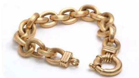
Figure 5 L'or jaune est une solution solide constituée de solutés (l'argent et le cuivre) et d'un solvant (l'or).

Les solutions solides sont appelées « alliages » lorsqu'elles contiennent deux métaux ou plus. Pour faire un alliage, les métaux doivent être chauffés jusqu'à ce qu'ils fondent, puis mélangés et refroidis. Le laiton est un alliage de cuivre et de zinc (figure 6). Le bronze est un alliage de cuivre et d'étain. Dans le laiton comme dans le zinc, le solvant est le cuivre. Quels sont les solutés ?