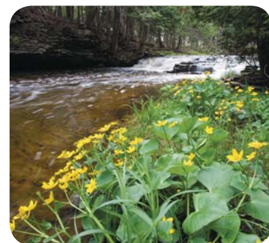
Figure 4 Grâce à leurs racines, les plantes absorbent les minéraux et les éléments nutritifs dissous dans l'eau.