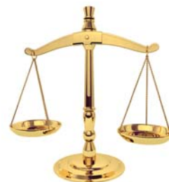
Figure 6 Le laiton est un alliage (une solution solide) de cuivre et de zinc.